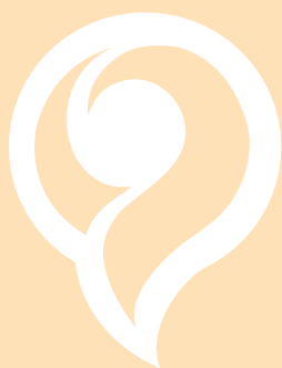
LOGO BLANC SUR FOND CLAIR