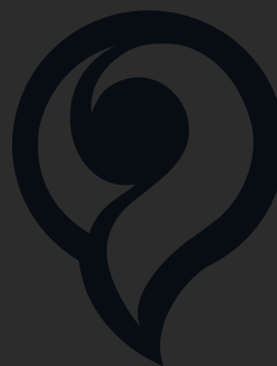
LOGO NOIR SUR FOND SOMBRE