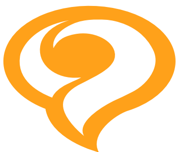
DÉFORMER LE LOGO